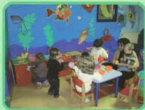
Halte-garderie de Fumay