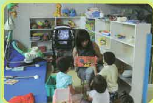
Halte-garderie de Givet