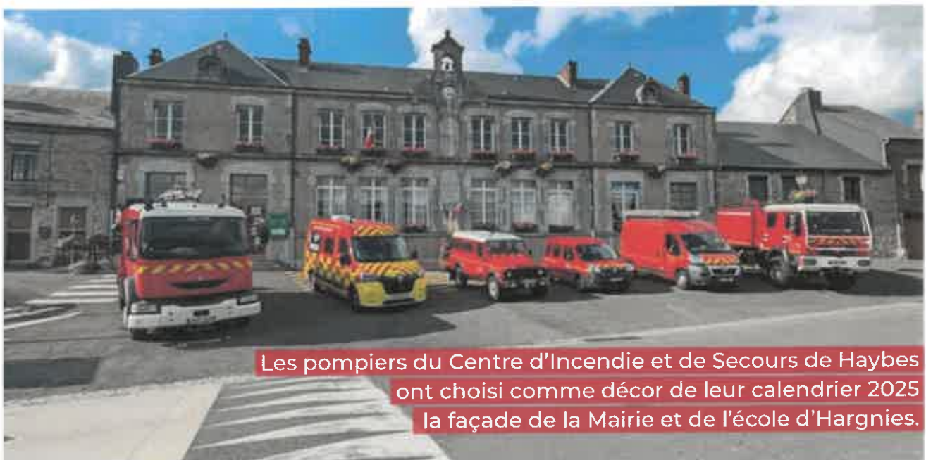
Les pompiers du Centre d'Incendie et de Secours de Haybes ont choisi comme décor de leur calendrier 2025 la façade de la Mairie et de l'école d'Hargnies.